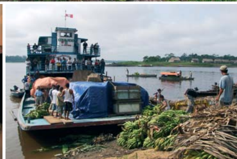
Lokal flodbåt som lastar bananer