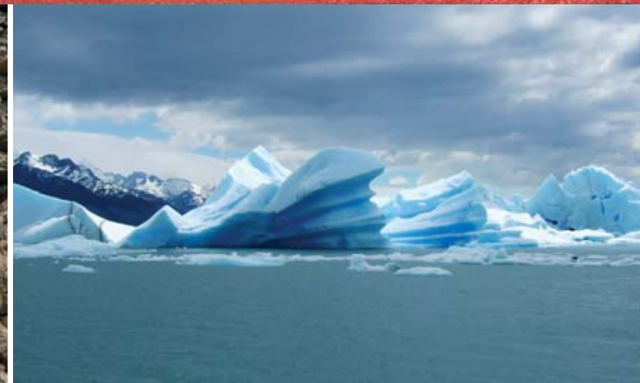
Glaciárdistriktet, Argentinska Patagonien