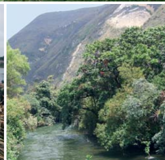
En av många tillflöden till Amazonas