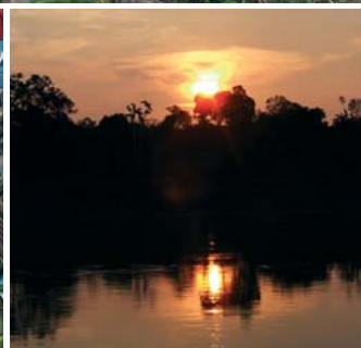
Solnedgång i Amazonas