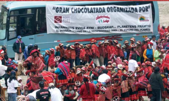
"Chocolatada" i byn Patacancha