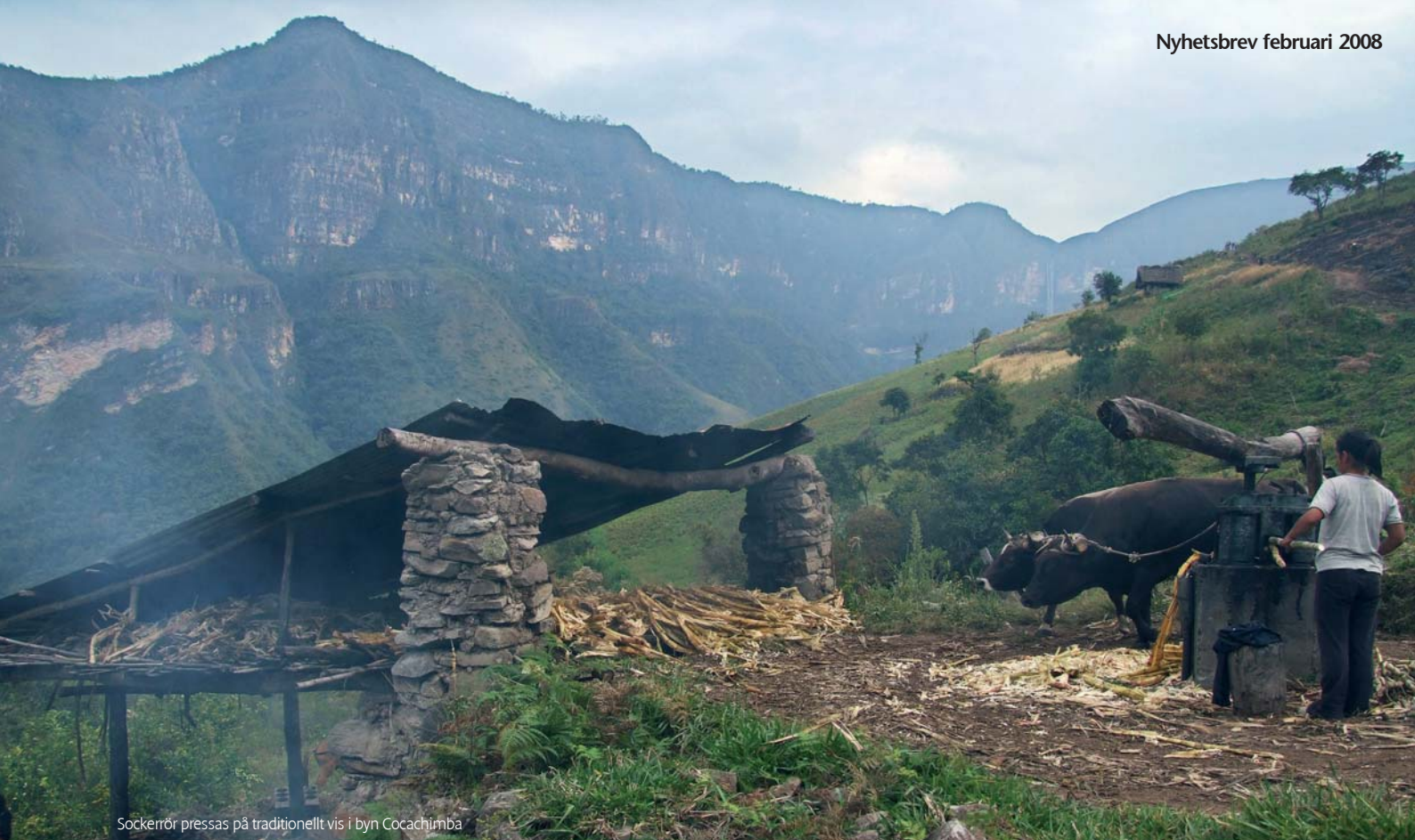
Sockerrör pressas på traditionellt vis i byn Cocachimba