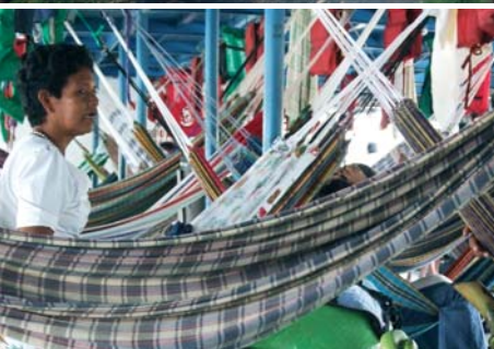
På väg mot Iquitos