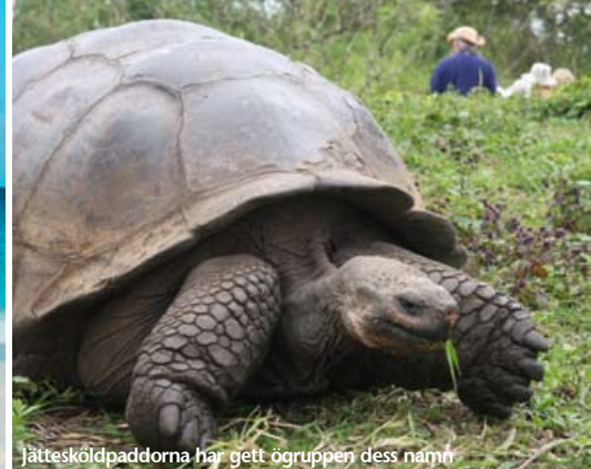
Jättesköldpaddorna har gett ögruppen dess namn