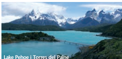
Lake Pehoe i Torres del Paine

Äntligen är det dags för favorit i repris, nästa år erbjuder vi återigen en resa till några av de mest fantastiska destinationer Sydamerika har att erbjuda! För vem har väl inte drömt om att uppleva de enorma glaciärerna i Patagonien, att vandra i Torres del Paines berömda nationalpark eller åka på valsafari vid Valdés-halvön? Detta kryddar vi förstås med besök vid Punta Tombos enorma koloni av Magellanpingviner, en härlig tangoafton i Buenos Aires och självklart även besök och grillfest vid Evert Taubes estancia där den välbekanta "Carmencita" kom till. Men det bästa är att resan fortsätter med nya fantastiska upplevelser... Vi avslutar nämligen rundresan med att åka upp till de mäktiga Iguacu-fallen och därifrån vidare till Rio de Janeiro med sin typiska stadspuls och självfallet Sockertoppen, Copacabana-stranden, samba och Kristusstatyn! Avresa 19/11 2011.