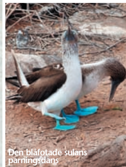
Den blåfotade sulans parningsdans