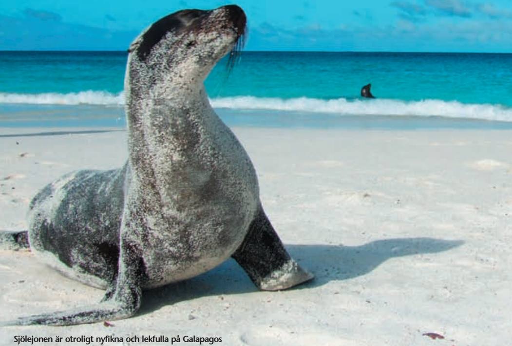
Sjölejonen är otroligt nyfikna och lekfulla på Galapagos