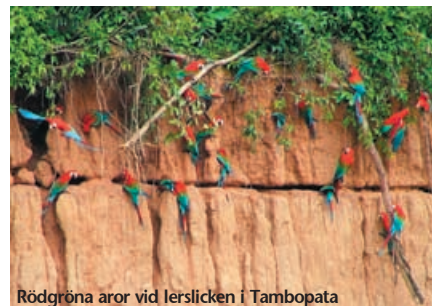
Rödgröna aror vid lerslicken i Tambopata

För en upplevelse utöver det vanliga rekommenderar vi ett lite längre program där man tränger djupare in i Tambopata reservatet. Här ökar chanserna markant att se mycket av djurlivet. Höjdpunkten på detta äventyr blir besöket man gör vid områdets stora lerslick där stora arapapegojor samlas i tidig morgonstund för att äta av den mineralrika leran. Ett färgsprakande skådespel som garanterat blir ett minne för livet!