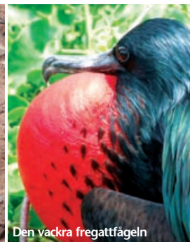
Den vackra fregattfågeln